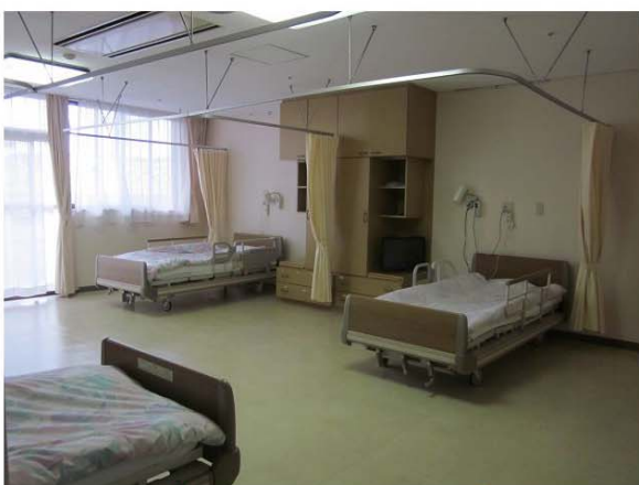
🌸 4人部屋 🌸