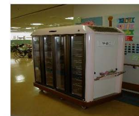
🌸 専用ワゴン 🌸