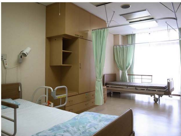
🌸 2人部屋 🌸