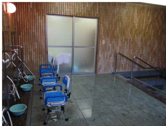
🌸 一般浴室 🌸