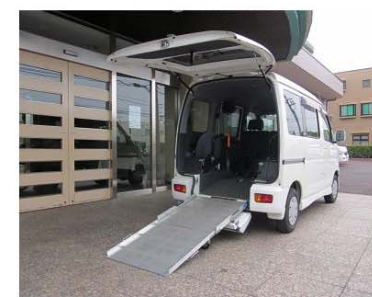
🌸 送迎車 🌸